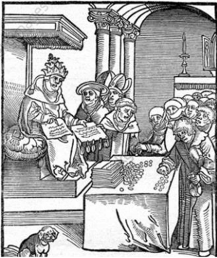
Lucas Cranach l'Ancien, détail de La vraie et la fausse Eglise , gravure, 1545.

Au cours du XVI e siècle, les critiques face à l'Eglise catholique se font plus virulentes. En effet, ses fidèles l'accusent de vouloir s'enrichir en monnayant le pardon des péchés avec les lettres d'indulgence , ainsi que les membres du haut-clergé qui vivrait dans l'opulence.