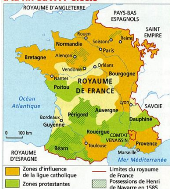
Carte issue d' Histoire-Géographie , CM1, Magellan, Hatier, 2010.

Sous la pression de l'Eglise catholique et devant les progrès du protestantisme, les rois de France, comme François Ier ou Henri II, commencent à persécuter les protestants. Ceux-ci sont sévèrement réprimés et les guerres de Religion opposant les catholiques aux protestants (huguenots) éclatent en France dès mars 1562 lors du premier grand massacre de protestants à Wassy. Ces guerres de Religion ravagent le pays et sont marquées par des violences de part et d'autre. Huit guerres se succèdent pendant plus de trente ans, jusqu'en 1598, entraînant des millions de morts.