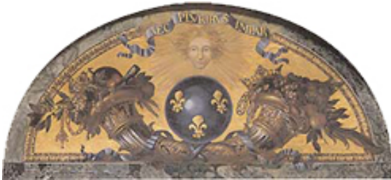
Peinture figurant sur un plafond du chateau de Versailles (« nec pluribus impar ») en 1672

La devise de Louis XIV est « nec pluribus impar » soit « le roi l'emporte sur tous les autres ». Il a choisi un surnom en rapport avec sa devise, qui est « Roi soleil » afin de faire référence au soleil qui est le plus grand des astres, ainsi le roi éclaire le monde et gouverne avec raison et intelligence.