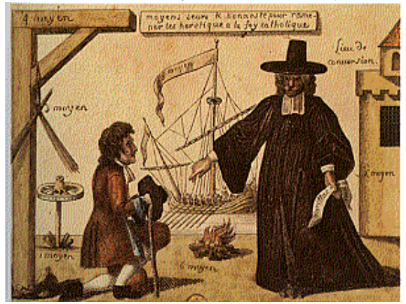
Moyens sûrs et honnêtes pour amener les hérétiques à la foi catholique », gravure.

La cour était devenue le lieu de l'exercice du pouvoir du roi puisque tous les organes de gouvernement étaient rassemblés à Versailles.