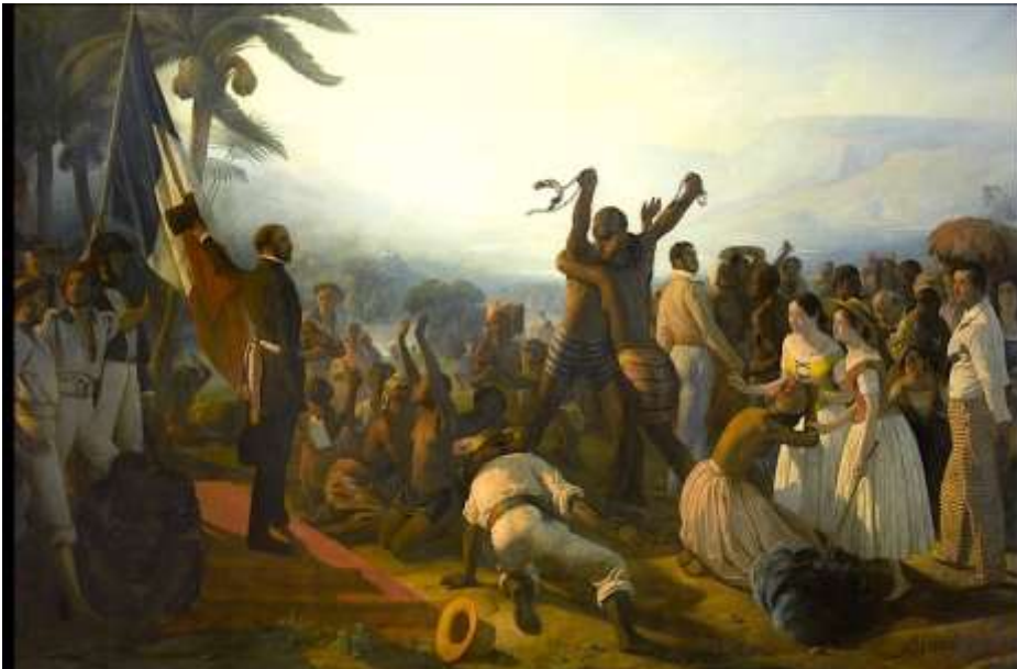
François Biard, L'abolition de l'esclavage , 27 avril 1848, 1849, Musée de Versailles, 261x391cm.