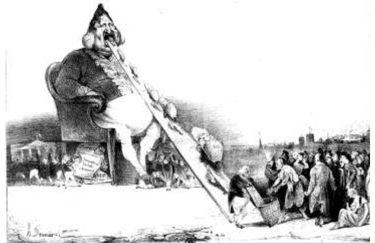
1832 : le dessinateur Daumier est condamné à 6 mois de prison et 500 francs d'amende pour son dessin du roi Louis Philippe Ier représenté en Gargantua, paru le 15 décembre 1831 dans le journal La Caricature .

Napoléon Bonaparte, Lettre à Fouché, 22 Avril 1804.