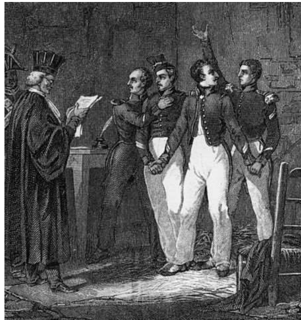
1822 : quatre sergents de La Rochelle suspects d'être hostiles au roi car républicains sont condamnés à mort et guillotins.

Lettre du sous-préfet de Fougère aux maires de son arrondissement, 1859.