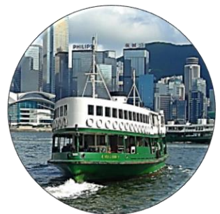
Manuel de géographie CM Magellan, Hatier, 2016, Paris

4. D'après ces documents, quels sont les différents moyens de transport en commun à Hong Kong ?