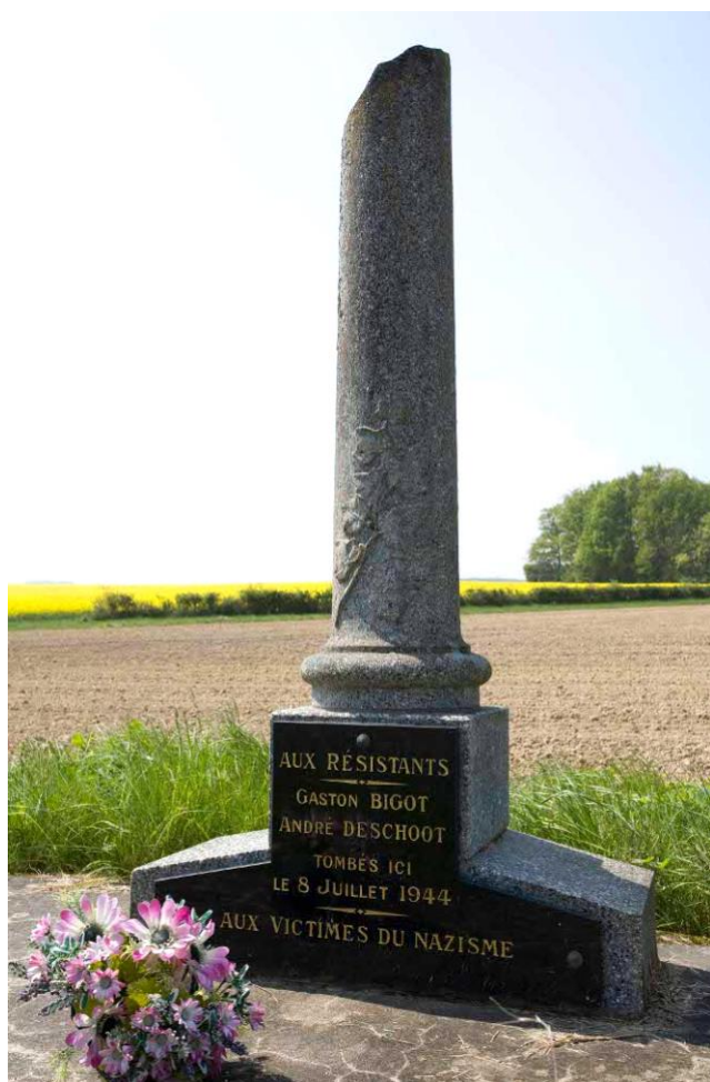
Stèle située à Genouilly (Cher)