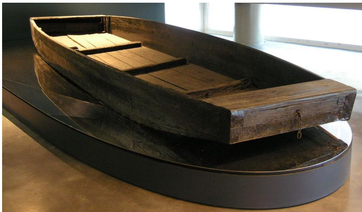
Barque à fond plat qui servait aux passeurs pour transporter des voyageurs clandestins de l'autre côté de la ligne de démarcation (Musée de la Résistance et de la Déportation du Cher)