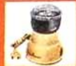
Année publicitaire de l'entreprise Moulinex parue dans des magazines français en 1959

PRIX ET QUALITÉ PAR LA PRODUCTION DE MASSE