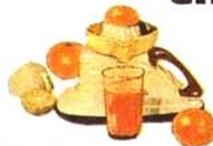
Presse-fruits : oranges, citrons, pamplemousses.

Une petite usine complète Démontage et nettoyage instantanés.