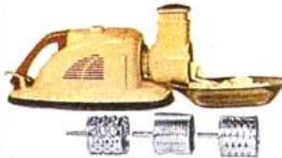
Râpe, coupe, tranche légumes et fromages.