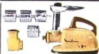
HACHOIR-MÉNAGER son Bloc-Râpeur

49,90 12,00 NF L'ensemble du combiné 59,90 NF