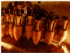
Doc. 4 Amphores romaines

II e siècle avant J.-C., Cavallion (Vaucluse). Ce monument présente une inscription écrite en grec.