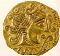
Doc. 6 Monnaie gauloise

Ce vase témoigne de la relation entre les Celtes et les Grecs.