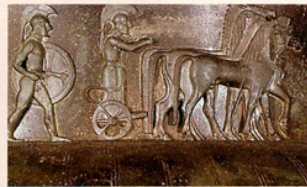
Doc. 5 Vase de Vix (détail)

II e et III e siècles avant J.-C., Châteaumeillant (Cher). Ces amphores contenaient du vin produit en Italie.