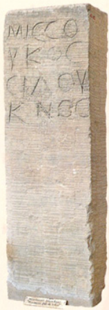
Doc. 3 Monument funéraire

II e siècle avant J.-C., Cavallion (Vaucluse). Ce monument présente une inscription écrite en grec.