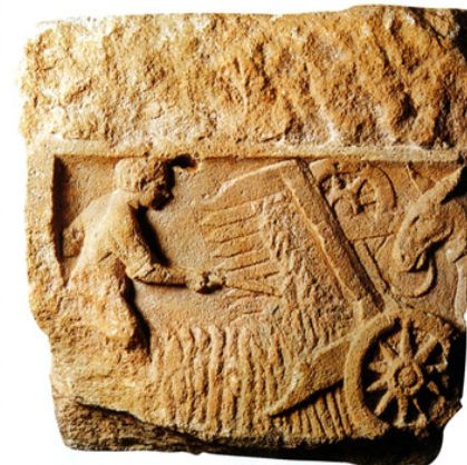
Doc. 9 Moissonneuse gauloise, sculptée Musée Guimet.