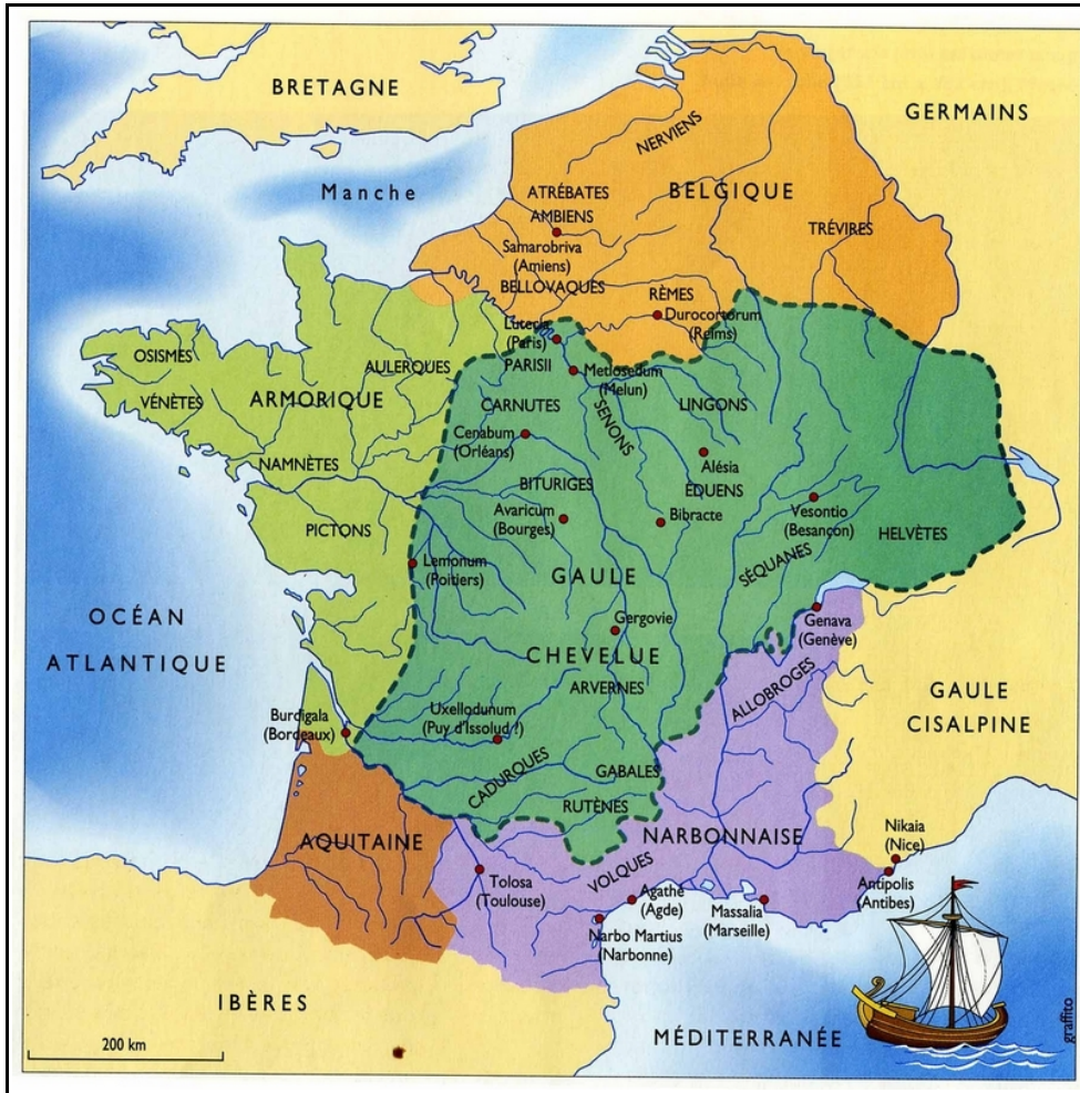
Doc. 1 – Carte de la Gaule avant la conquête romaine (« La Gaule de Vercingétorix », TDC, n° 670, février 1994, p. 19)