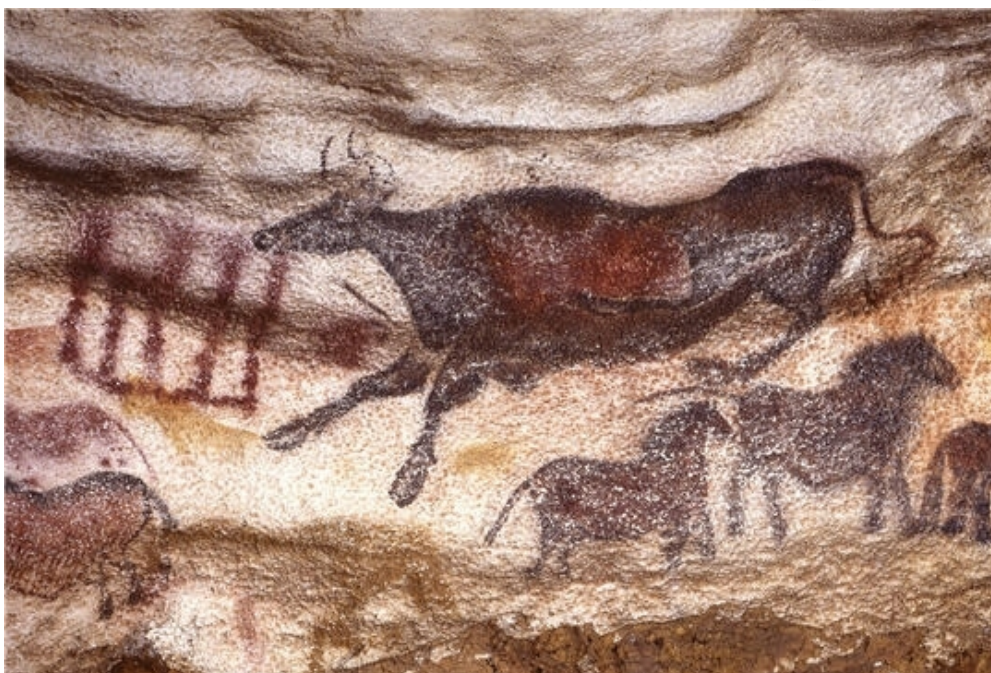
Doc. 5 - Grotte de Lascaux (Dordogne) : devant le museau de la vache, un signe linéaire et un signe en grille ; au registre inférieur, une frise de chevaux, vers 18 900 BP (d'après Denis Vialou, La vache sautante de Lascaux , Scala-CNDP, Paris, 2003)