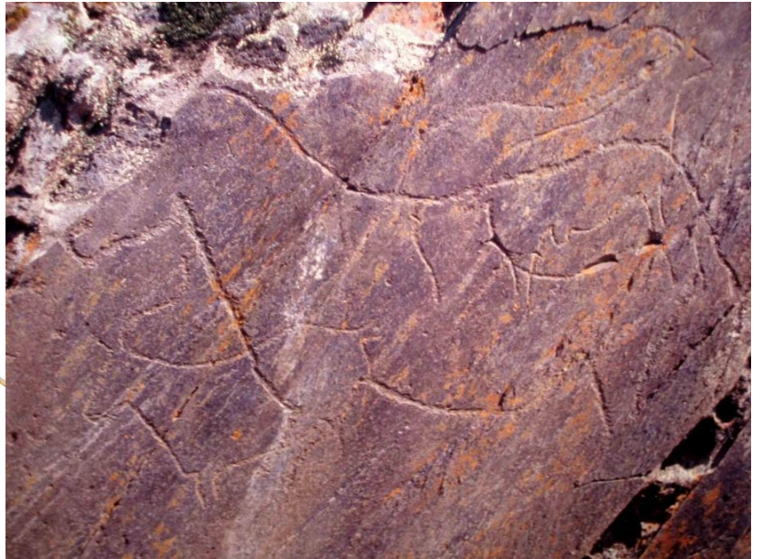
Doc. 4 - Gravure rupestre de la vallée du Côa (district de Guarda, Portugal), vers 20 000-8000 avant J-C