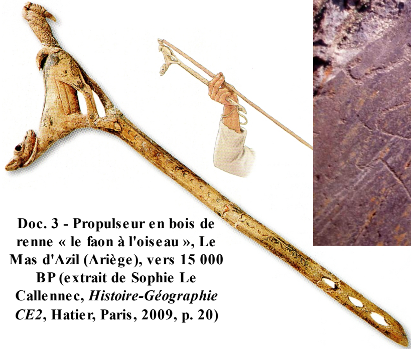
Doc. 3 - Propulseur en bois de renne « le faon à l'oiseau », Le Mas d'Azil (Ariège), vers 15 000 BP (extrait de Sophie Le Calennec, Histoire-Géographie CE2 , Hatier, Paris, 2009, p. 20)