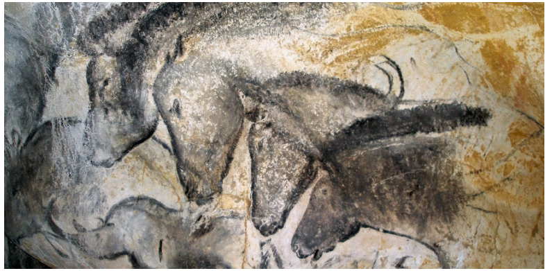
Doc. 2 – Le panneau des chevaux dans la grotte Chauvet-Pont d'Arc, Ardèche, 32 000-30 000 BP