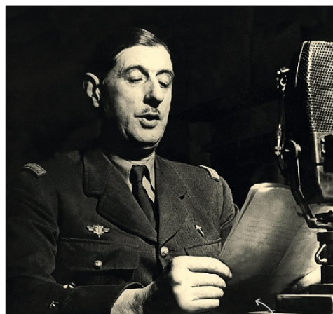
Le général de Gaulle en 1940.

Document 2 : Un membre de la résistance française (un résistant) plaçant une charge explosive en 1944.