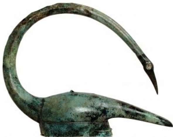
Doc. 2 - Le casque-cygne de Tintignac (Naves, Corrèze), bronze, IV e -III e siècle avant J.-C.

Doc. 3 - Reconstitution du sanctuaire de Gournay-sur-Aronde au III e siècle avant J-C (dessin de Jean-Louis Brunaux, « Le sanctuaire gaulois de Gournay-sur-Aronde », dans Bulletin de la SAH de Boulogne-Conchy- Hainvillers et alentours, n° 56, octobre 2002)