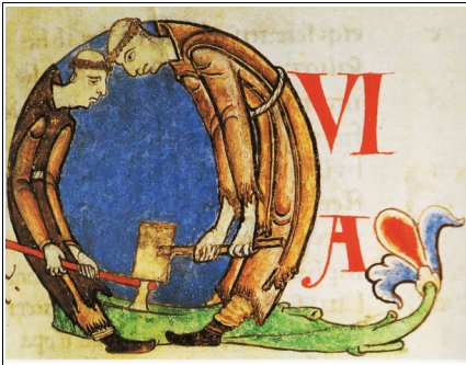
Doc. 4 - Moines cisterciens en train d'équarrir un tronc d'arbre (a) et de moissonner (b), enluminures d'un manuscrit de Cîteaux, XIIe siècle, bibliothèque municipale de Dijon