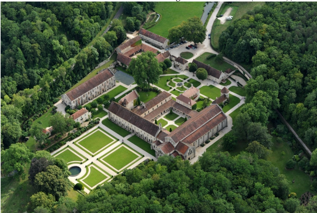
Doc. 2 - Abbaye cistercienne de Fontenay (Marmagne, Côte d'Or), fondée en 1118 par Bernard de Clairvaux

Règle de Saint-Benoît (vers 540), trad. P. Schmitz (modifiée), 1987