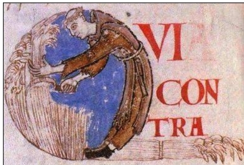
Doc. 5 - Moine copiste, manuscrit de l'abbaye bénédictine de Saint-Vaast (Pas-de-Calais), enluminure, XIIe siècle, Musée des Beaux-Arts d'Arras