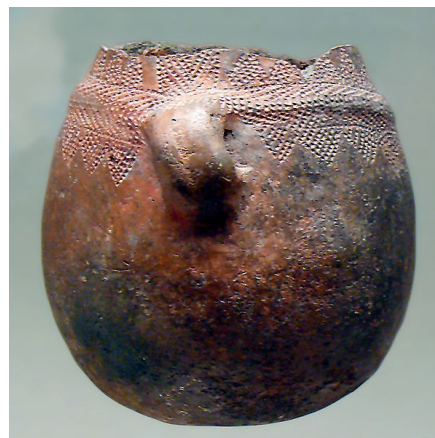
2 - Céramique cardiale, grotte de la Sarsa (province de Valence, Espagne), Vers 6000-5000 avant J-C