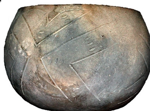
3 - Céramique rubanée, vers 5000 avant J-C