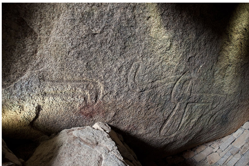
5 - Dalle de couverture de la Table des marchands