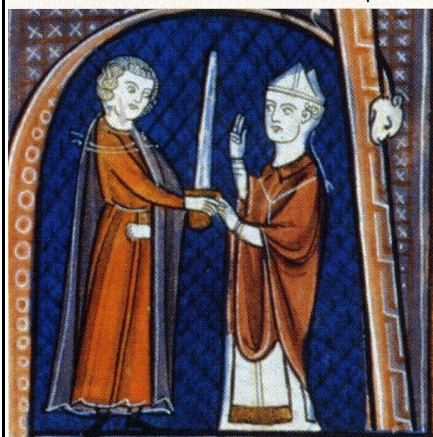
c. La remise de l'épée