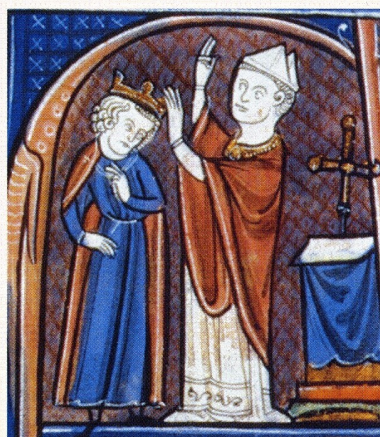
d. Le couronnement. Le roi reçoit de l'archevêque la couronne.

Doc. 1 – Cérémonie du sacre dans la cathédrale de Reims, miniatures, Ordre de la consécration et du couronnement des rois de France, vers 1280, BNF Paris ( Histoire-Géographie 5e , Magnard, Paris, 2004)