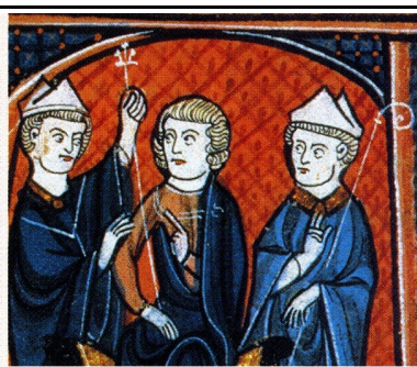
b. La remise du sceptre.