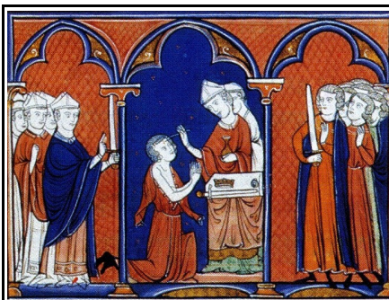
a. L'onction. L'archevêque oint le roi de l'huile sainte. Le connétable tient l'épée.

En vous appuyant sur les documents ci-dessous, montrer comment la royauté capétienne a réussi à établir son autorité sur le royaume de France au Moyen Âge (Xe-XVe siècles)